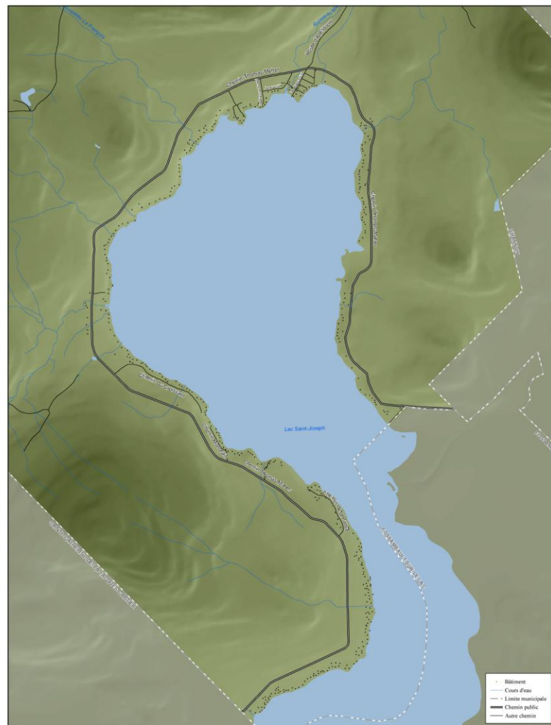
Figure 2 - Carte des voies de circulation de Lac-Saint-Joseph

L'ouverture de nouvelles rues, quel que soit leur mode de tenure, ainsi que l'implantation de tout autre réseau de transport ne sont pas souhaités.